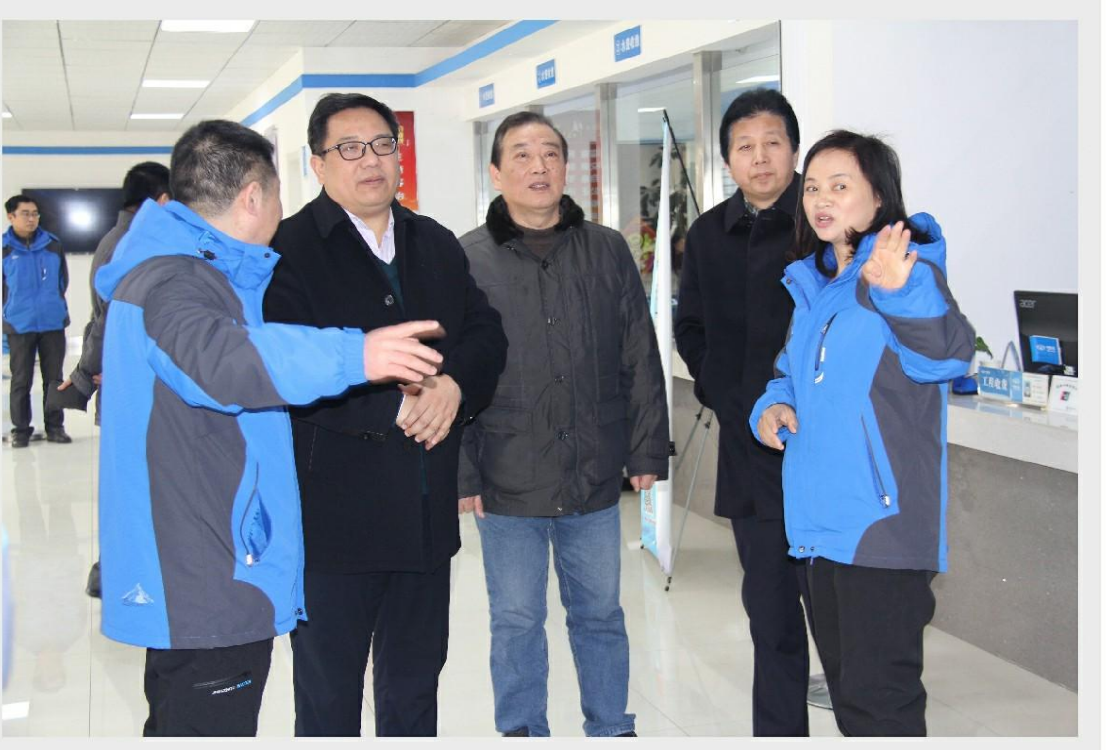
2月5日,荆州市政府秘书长、市建委主任一行检查集团公司春节前安全生产工作。

荆州市内部资料准印证第36号 2016年2月19日 星期五 总第143期 地址:荆州市南湖路9号 电话:0716-4309982 E-mail:jsjtdqb@163.com