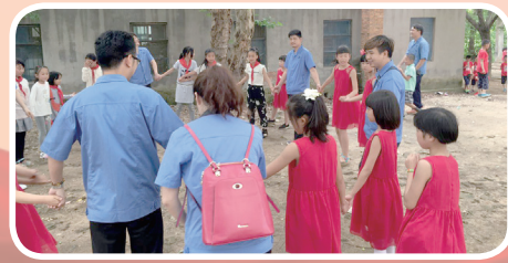
5月28日,产业党支部第一党小组党员们陪纪南九店小学留守儿童过六一。