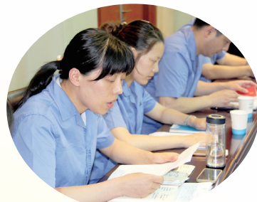
党员在组织生活会上做自我剖析。

为严格党的组织生活,提高党员素质,增强党员党性,巩固“两学一做”成果,抓好“上善若水映党徽”基层党组织创建活动,6月上旬,各党支部召开了“两学一做”组织生活会,每位党员针对《党章》、《条例》、《准则》进行了对照检查。