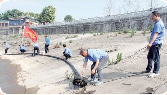
5月31日,制水党支部第三党小组加固宝塔湾江边“救命一米线”。