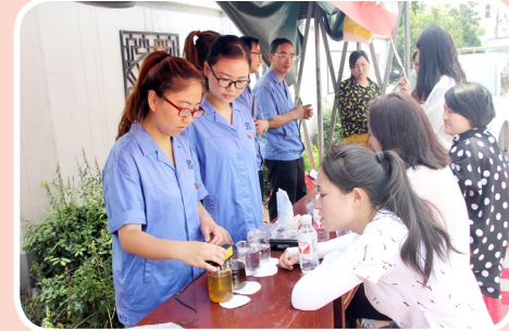
5月31日,制水党支部第四党小组全体成员深入荆州区新风社区为居民现场答疑解惑。