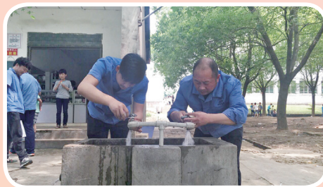
5月28日,产业党支部第一党小组党员们为纪南九店小学修水龙头。

产业党支部第一党小组于5月28日来到纪南九店小学,对学校的供水管网及设施进行了检查维修,为学校食堂更换了9个水龙头,同时还对校区内的洗手池进行了清洁维修,让学生们更安全方便地用水;第二党小组于5月26日上午来到金源世纪城,对5号地块地下室泵站进行清洁;第三党小组于5月26日上午,为白云桥社区的居民开展供水知识宣传,并义务为居民维修供水设施。