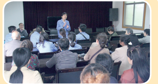
5月26日,机关党支部第二党小组走进洪境小区开展供水工作宣传。