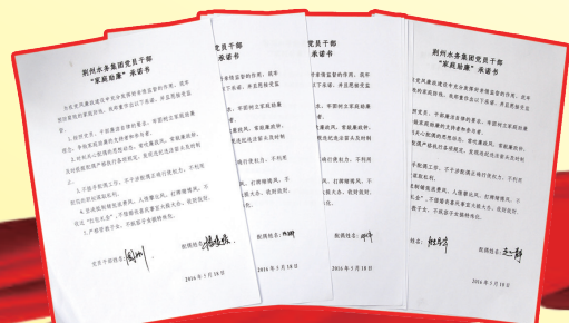
党员干部家庭助廉承诺书