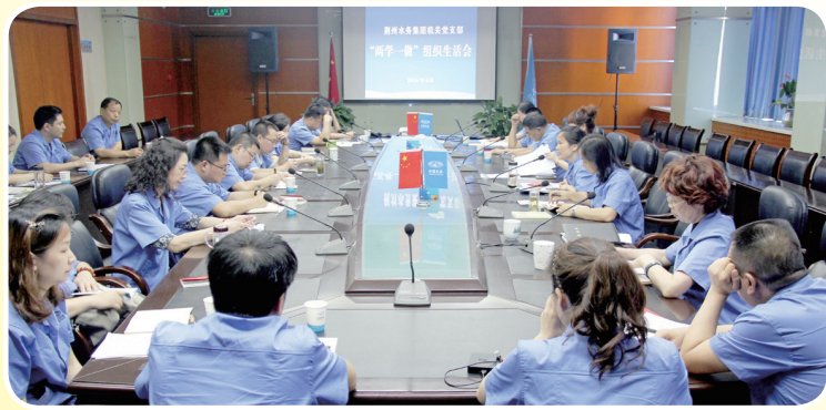
6月上旬,各党支部召开了“两学一做”组织生活会。