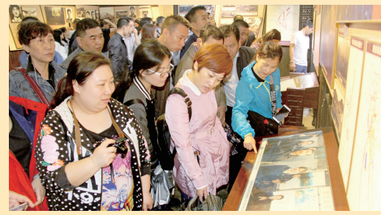
6月2日至3日,部分党员干部赴革命老区红安参加国资委组织的革命传统教育和党性教育活动。