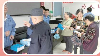
5月26日,产业党支部第三党小组的党员们来到白云桥社区,宣传供水知识,义务为居民维修供水设施。