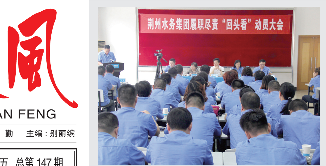
5月6日,集团公司2016年度履职尽责“回头看”工作动员大会在活动中心三楼会议室召开。