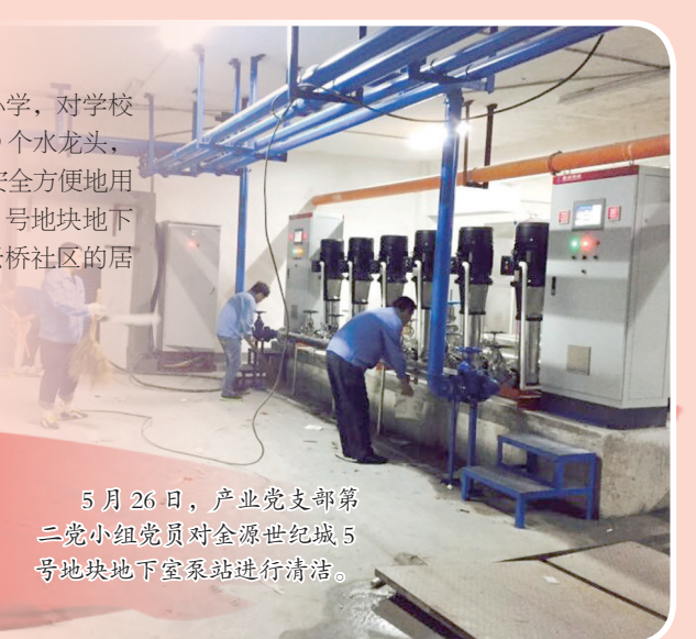
5月26日,产业党支部第二党小组党员对金源世纪城5号地块地下室泵站进行清洁。