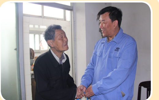
5月27日,供水党支部第四党小组走进银海社区慰问贫困居民。