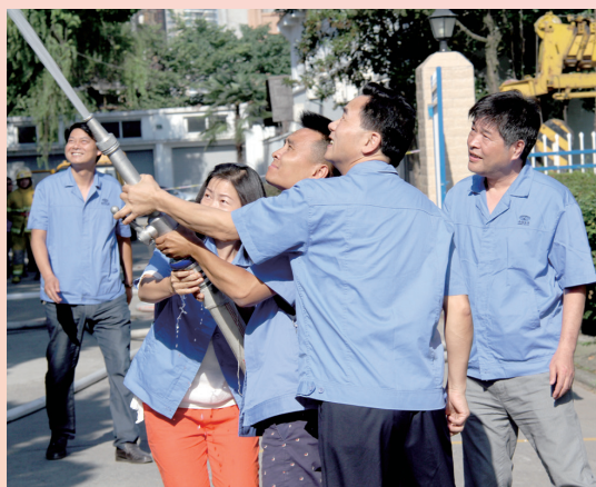
6月17日,进行漏氯实战演练。

为提高大家的履职能力,集团公司以多种形式开展了一系列的培训。5月12日下午,信息建设中心在活动中心三楼会议室组织进行了关于《天翼对讲可视化调度平台》巡更巡线系统的培训;4月28日,水质检测中心技术小组一行到国家城市供水水质监测网武汉监测站考察学习;5月20日,水质检测中心在活动中心三楼组织了一次员工业务培训;6月17日下午,安保部在活动中心三楼组织了安全培训,首先请市安监局专家讲授《给水企业班组安全管理》,培训结束后,由消防支队出动3辆消防车和12名消防官兵进行漏氯实战演练。