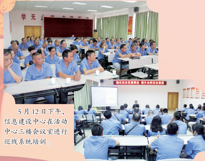
5月12日下午,信息建设中心在活动中心三楼会议室进行巡线系统培训。