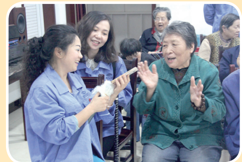
5月26日,供水党支部第三党小组走进晴川养老院,陪老人唱红歌。

供水党支部第一党小组于5月8日组织开展“微实事”微信服务活动;第二党小组于5月13日对十方庵社区居委会、共青路公厕以及大庆路公厕三块“黑表”进行了清洗并重新封签,确保该类水表日后正常抄表;第三党小组于5月26日上午,联合王板桥社区,走进晴川养老院,为老人读报、讲授养生知识、修马桶和唱红歌;第四党小组于5月27日上午,自筹资金购买大米、食用油,来到银海社区,走访慰问沙棉生活区的孤寡老人,为他们送去了荆水员工的温暖。