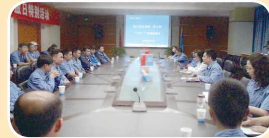
6月2日上午,机关党支部第一党小组组织集团劳务工召开交流座谈会。

活动中,机关党支部第一党小组于6月2日上午,组织集团劳务工召开交流座谈会;第二党小组于5月26日,到洪境小区开展供水工作宣传;第三党小组于5月28日,组织党员参观了柳林水厂蜂窝斜管改造项目和景观观路管改造工程。