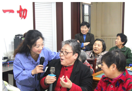
一切 本报讯（通讯员 陈丽玮）10月28日是中国传统节日——重阳节。10月26

日，荆州水务集团的党员代表和青年志愿者们提前来到位于王板桥社区的晴川养老院，为这里的老人们带来了精彩纷呈的文艺节目和暖心的礼物，他们和社区工作人员一道，陪30余位老人欢度重阳。 岁岁重阳，今又重阳，十九大胜利闭幕和重阳节这双重喜庆，让晴川养老院里的老人们格外开心。党的十九大以来，社区的老人们都对未来更加充满信心，老人们的生活被丰富多彩的文化活动点缀的有声有色。