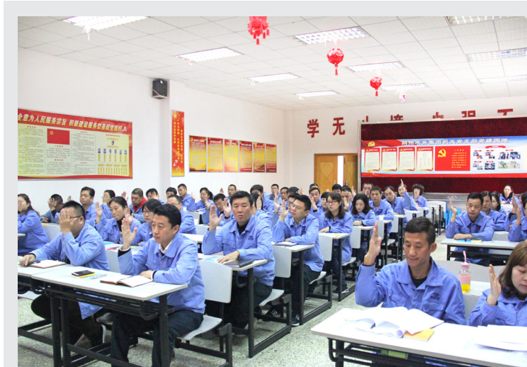
10月26日，荆州水务集团工会第三届一次职工代表大会顺利召开。

荆州市内部资料准印证第 36 号 2017 年 11 月 17 日 星期五 总第 165 期 地址：荆州市南湖路 9 号 电话：0716-4309982 E-mail:jsjtdqb@163.com